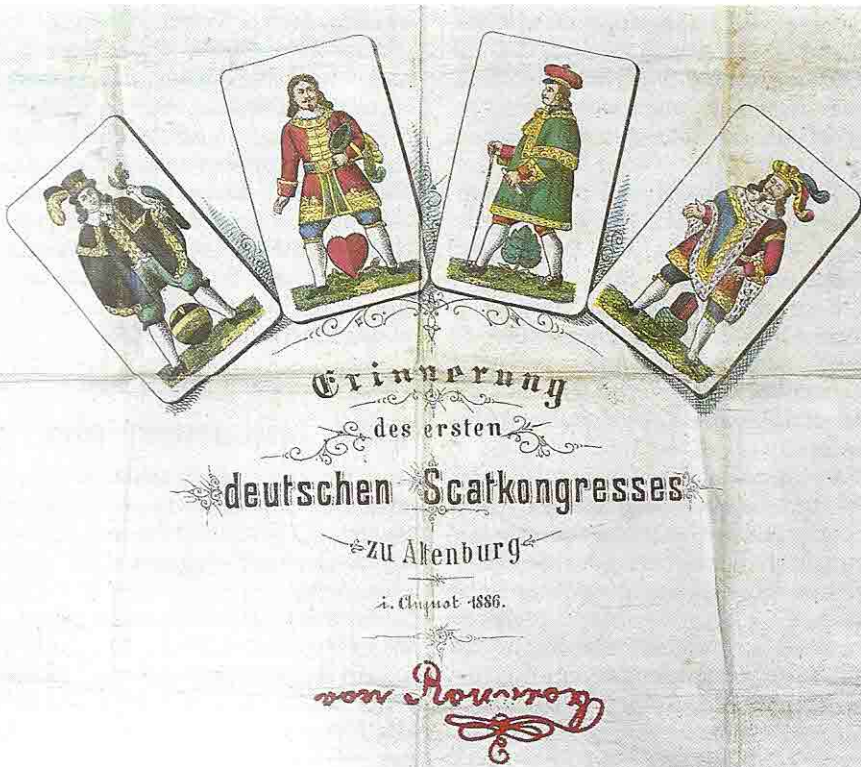
Tuch zur Erinnerung an den I. Deutschen Skatkongreß 1886, Deutsches Spielkarten-Museum Leinfelden-Echterdingen

Mit seinen umfangreichen Beständen europäischer, indischer, chinesischer und japanischer Spielkarten, der Spezialbibliothek, seinem Archiv und den kunstgewerblichen Gegen-