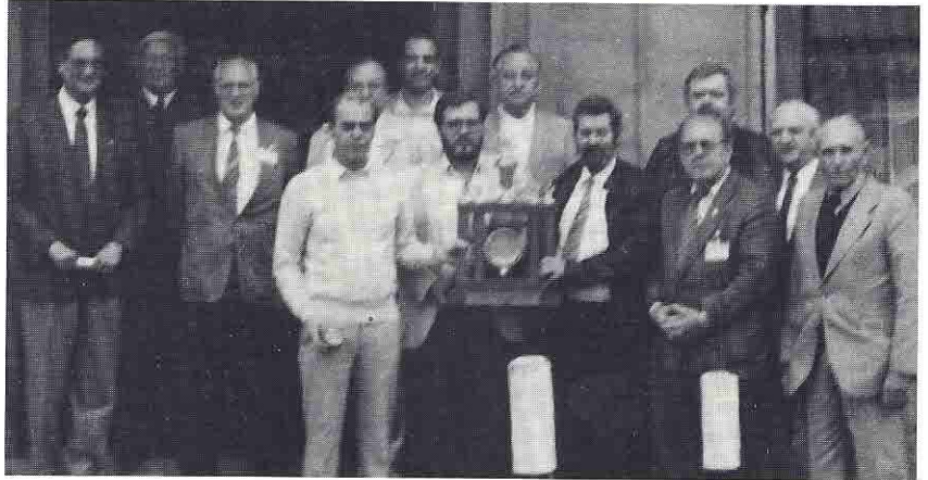
Das erfolgreiche Team aus Köln

türlich nur durch die ständige Punktstandsanzeige möglich. Und hierin liegt auch der besondere Reiz dieses Wettkampfes, bei dem jede Mannschaft zwölf Spieler in ihren Reihen hat.