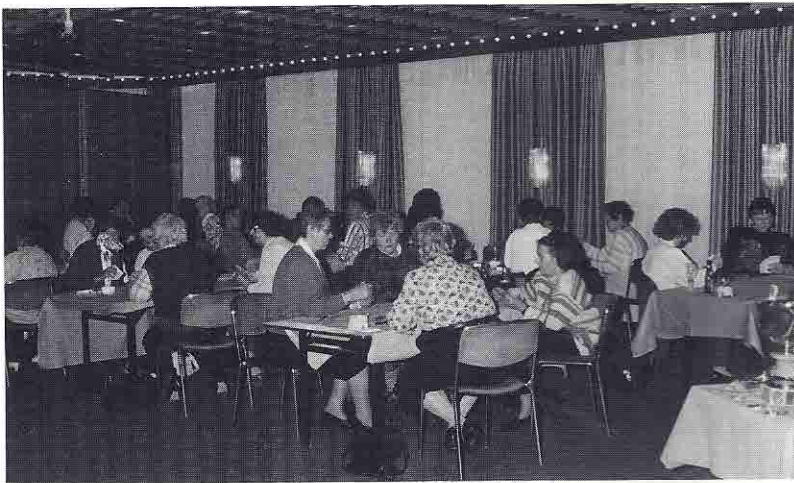
Mit konzentrierter Aufmerksamkeit sind die Bundesliga-Damen beim Spielgeschehen.

Während die Akteure mit dem Einsatz ihres ganzen Könnens versuchten, auf der Punkteleiter nach oben zu klettern oder den Gegnern den Weg zur Spitze zu verbauen, wurden gelegentlich auch die Regelkenntnisse des amtierenden Schiedsrichters Helmut Schmidt (Bielefeld) gefordert. Und der zeigte sich sattelfest.