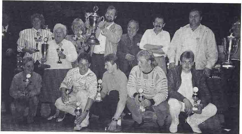
Die Mannschaftssieger von Erlangen