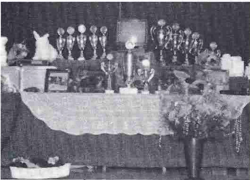
Zu gewinnen waren 89 Einzelpreise, 3 Mannschaftspreise und 11 Pokale.

Die beste Damenmannschaft stellte mit 40 274 Punkten der Landesverband 8 (siehe Bild oben). Mit knappem Vorsprung zogen die Spielerinnen vom LV 1, die 36 409 Punkte auflisteten, als Zweite vor der LV 2-Mannschaft über die Ziellinie, deren Spielerinnen 36 389 Punkte erreichten.