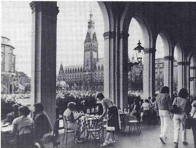
Gemütliches Kaffeestündchen mit einem Hauch südländischer Atmosphäre in Hamburgs schönstem Säulengang. Die Alsterarkaden, die Alexis de Chateauneuf im 19. Jahrhundert schuf, entstanden einst nach venezianischen Vorbildern.

Dagegen ist die hundertjährige Speicherstadt mit ihren pittoresken Türmchen und Backsteinfassaden immer noch der Welt größter zusammenhängender Lagerhauskomplex. Ein herrlicher Anblick bietet sich bei Nacht