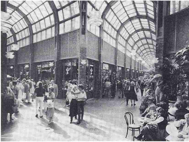
Zu einem fröhlichen Schaufenster der Welt ist das »Hanse-Viertel« in Hamburg geworden – ein beliebter Treffpunkt von jung und alt.

men der Hauptkirchen und des Rathauses bestimmt. Von Hamburgs barockem Wahrzeichen, dem Michel, kann man in luftiger Höhe Hafen, Alster und Alt-Hamburg überblicken. Alt-Hamburgische Bürgerhäuser, von denen in der Deichstraße und im Cremon noch einige erhalten sind, vereinigten früher häufig Kontor, Speicher und Wohnung des Kaufmanns