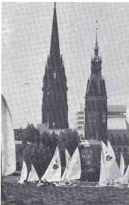
Die Außenalster mitten in der Hamburger City. Im Hintergrund die Türme der St. Nikolai-Kirche (links) und des Rathauses (rechts).

Hamburg ist die einzige Großstadt Deutschlands mit einem glitzernden See in der Mitte. Man kann die Außenalster umrunden oder dem Alsterwanderweg von der Fuhlsbüttler Schleuse nach Norden folgen. Segeln und Surfen in der City, in welcher Stadt ist das sonst noch möglich? Von den Möglichkeiten, am Elb-